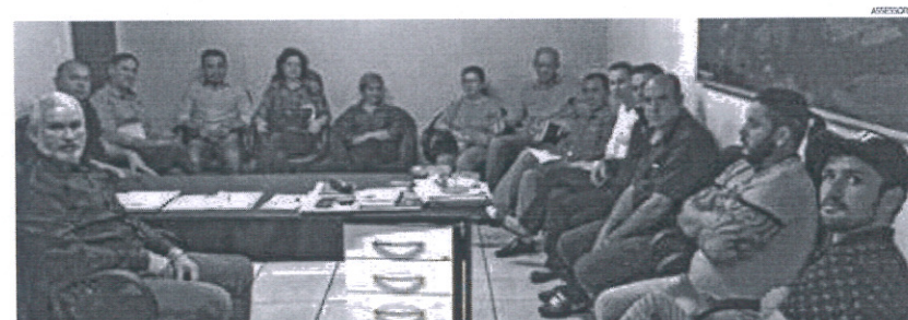
EQUIPE DE GOVERNO DO MUNICÍPIO

NA REUNIÃO FOI DECIDIDO O CARGO DE COLABORADORES PARA ESTA NOVA GESTÃO